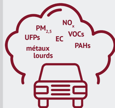
Pollution atmosphérique issue du trafic routier